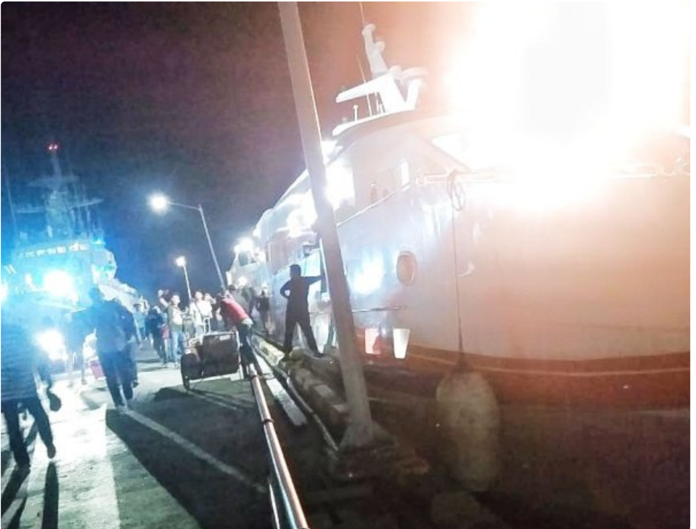
Pihak Penyidik Polda Sultra Dari Kendari Tiba Di pelabuhan Murhum Baubau. Rabu (23/08)

BAUBAU - Informasi beredar jika Pihak Polda tiba diBaubau malam ini, Rabu (23/08)